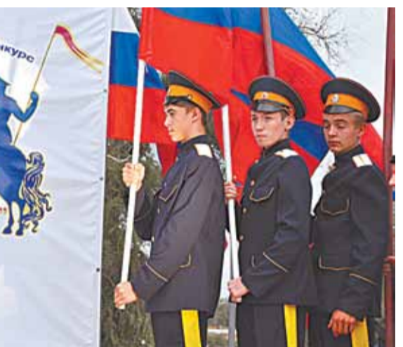
Под знамена фестиваля встали казаки со всего юга России

В наше время в Астраханском крае воссоздали казачье войско, штаб по возрождению традиций казаков. Наши камышовские ансамбли – «Раздолье», «Веселые колокольчики», «Саратовские гармошки» – одни из первых в районе стали петь на сцене казачьи песни.