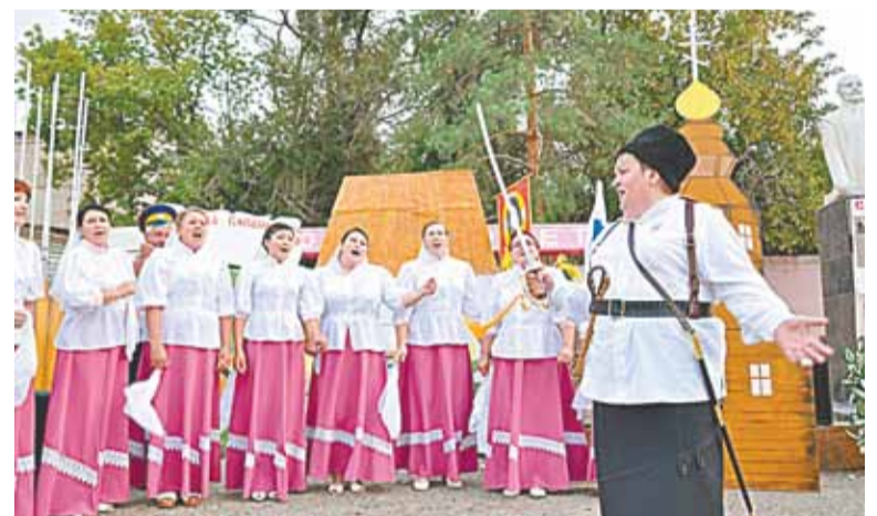
Над енотаевскими станицами в фестивальные дни неслись зажигательные казачьи песни