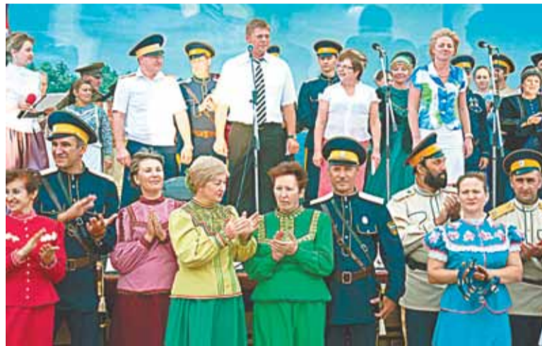
Главной сценой и зрительным залом стала центральная площадь Енотаевки